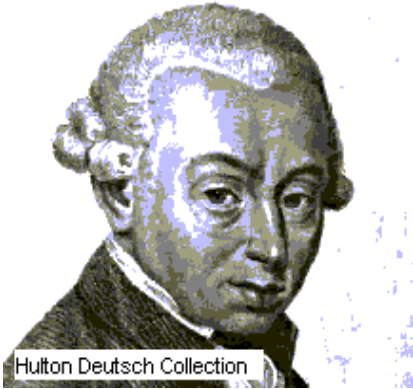
Immanuel Kant (1724 – 1804)

Quizá una de las mayores aportaciones a la Ética fue hecha a finales del siglo XVIII por el filósofo alemán Immanuel Kant en su Fundamentación de la metafísica de las costumbres (1785).